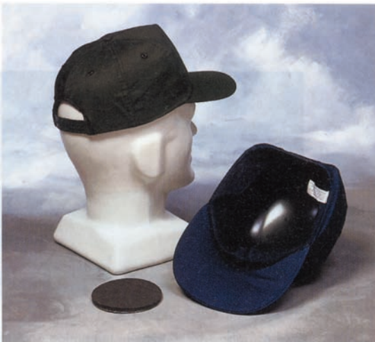
Bild 6: Industrie-Anstoßkappe mit textiler Umhüllung als Schirmmütze