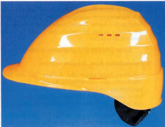
Bild 2: Industrieschutzhelm mit heruntergezogenem Nackenteil, Belüftungsöffnungen und seitlichen Schlitzen zur Befestigung von Zubehör (z.B. Gehörschützer), jedoch ohne Regenrinne