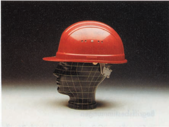
Bild 1: Industrieschutzhelm mit Regenrinne, Belüftungsöffnungen und seitlichen Stecktaschen zur Befestigung von Zubehör (z.B. Gehörschützer)