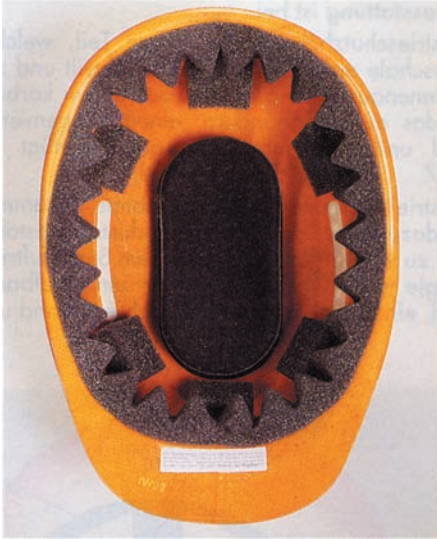
Bild 8: Industrieschutzhelm für Kopfverletzte mit Schaumstoff-Innenausstattung