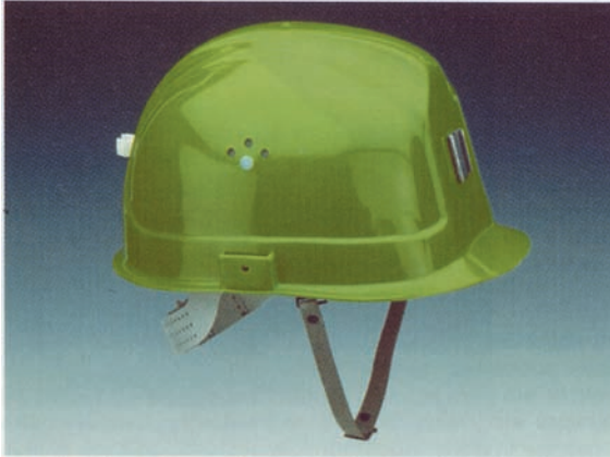
Bild 3: Industrieschutzhelm mit verkürztem Schirm, Lampen- und Kabelhalter, Kinnriemen (Zubehör)